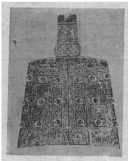
图一 铸及铭文(照片)

据宋赵明诚《金石录》和石公弼题记 (《覆斋》33)，此器是宋徽宗政和三年 (1113年)出土。出土地点，赵说在“鄂州 嘉鱼县”，石说在“武昌太平湖”。按顾祖 禹《读史方舆纪要》卷七六，嘉鱼县南三十 里有“太平湖”，石氏所谓“武昌太平湖” 者当是“嘉鱼太平湖”之误(宋代武昌在今 湖北鄂城县)。宋代嘉鱼县出土铜器，前此 约哲宗年间还有过一次，见秦观《淮海集》